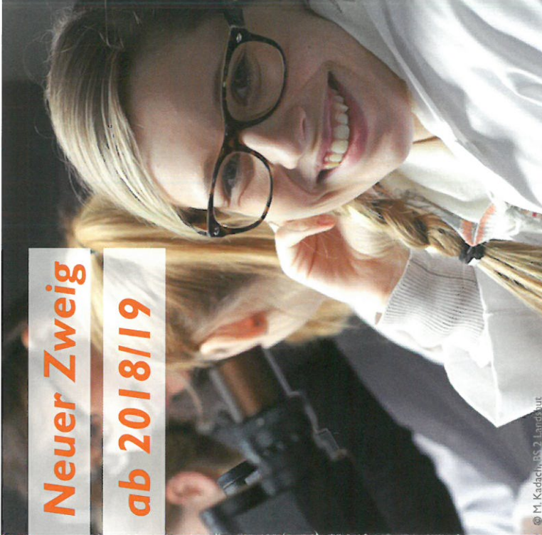
© M. Kadach, BS 2, Larnal/ut